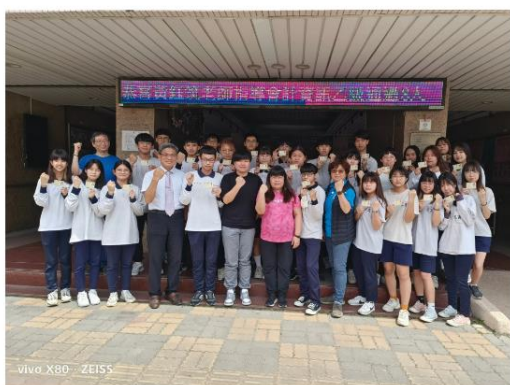
花商乙級檢定表現優異