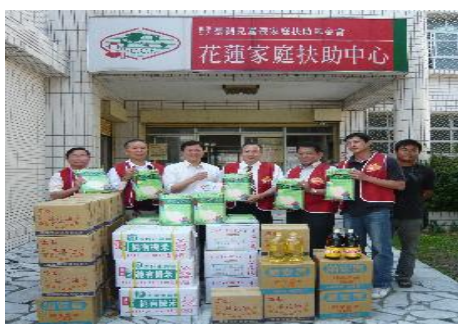
← 捐贈物資予弱勢家庭。

秉持以『及時的扶助、溫暖的關懷、基督的愛心、社工的專業』之服務精神為兒童謀福利。