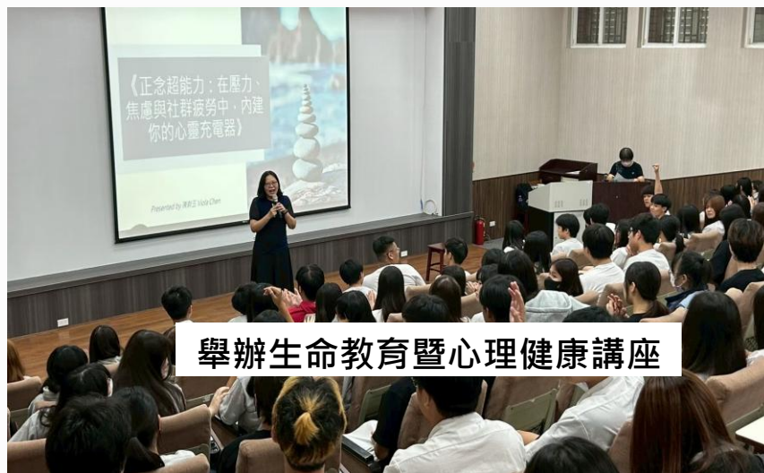
舉辦生命教育暨心理健康講座