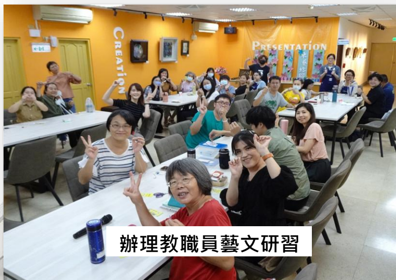
辦理教職員藝文研習