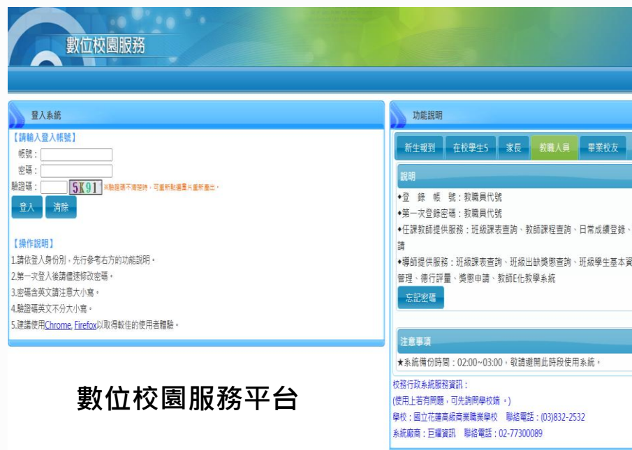
數位校園服務平台