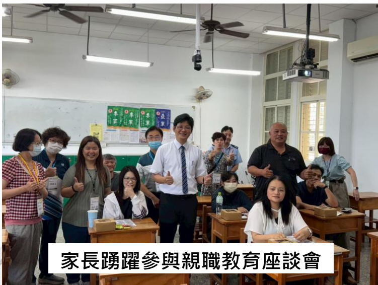
家長踴躍參與親職教育座談會