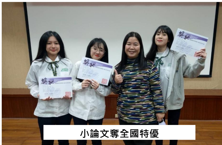
小論文奪全國特優