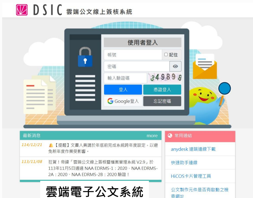
雲端電子公文系統