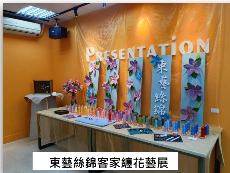
東藝絲錦客家纏花藝展