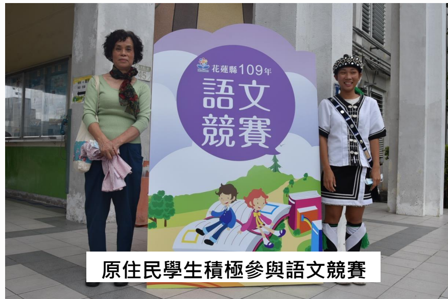
原住民學生積極參與語文競賽