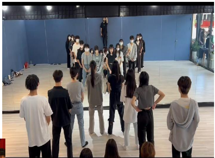
假日時間在舞蹈教室練習