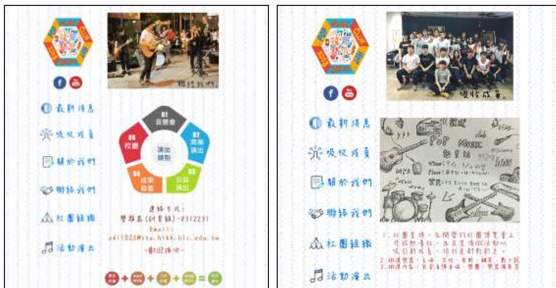
網頁部分畫面 - 分頁