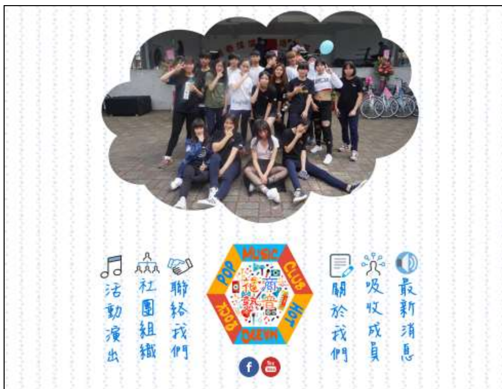
網頁部分畫面 - 首頁