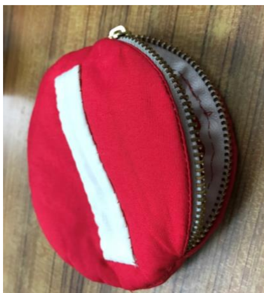
長方形零錢包(箭頭號誌)