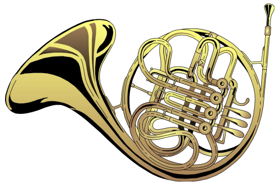
法國號 (French Horn)