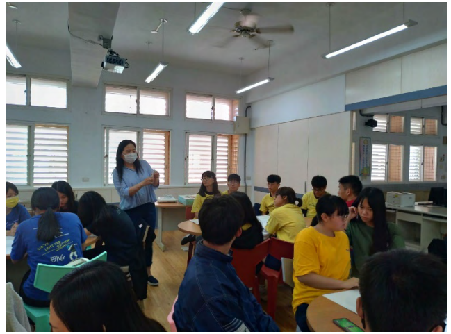
2020 年 04 月 01 日整理創世基金會 DM、信封及義賣品製作