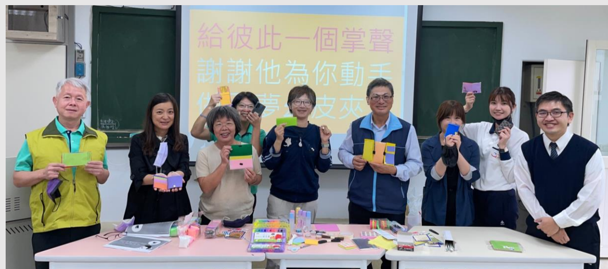
110.11.22 跨域教學與學習歷程之模式建構 - 實作應用篇