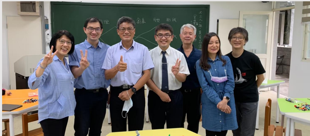
110.10.20 跨域教學與學習歷程之模式建構 - 設計思考篇