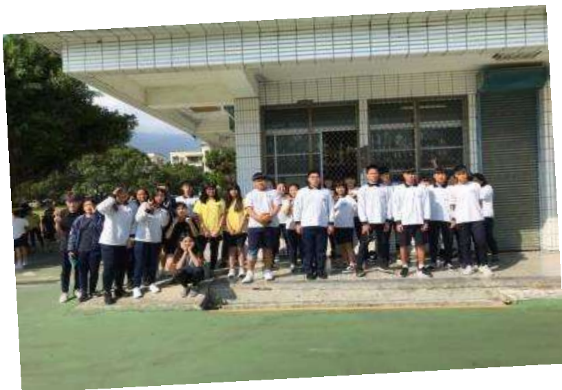
圖：(排球社全體大合照)