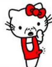
HELLO KI 秋