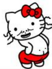
HELLO KI 笑