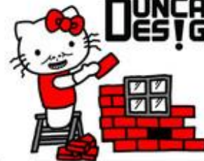
HELLO KI 厝