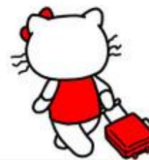
HELLO KI 叨位