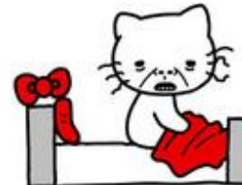
HELLO KI 厝