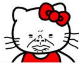
HELLO KI 賭爛