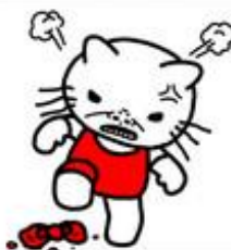
HELLO KI 死