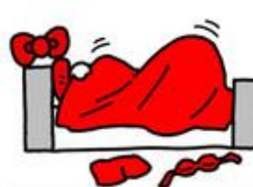
HELLO KI 摸幾