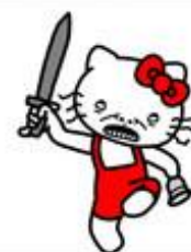
HELLO KI 乩乩