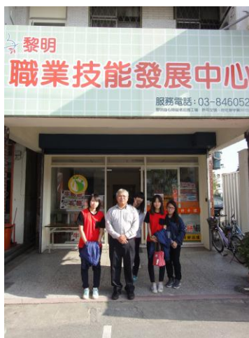
圖15 離開前的合影留念