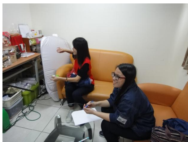
圖13 參訪前興奮的心情