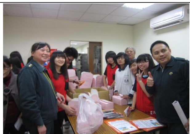
圖7 教官也到場助陣