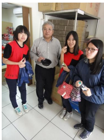
圖14 主任請我們吃小點心