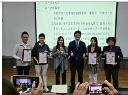
頒發傑出校友當選證書