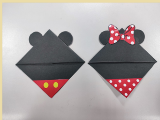
愛心工藝品成品捐贈發票可兌換