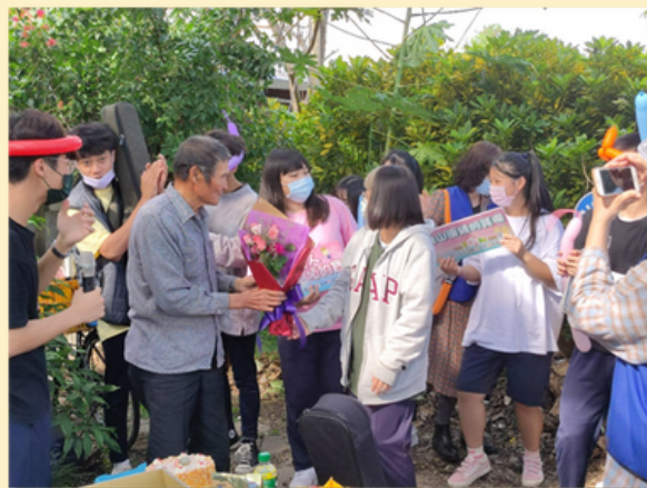
扶少團長致贈慶生花束