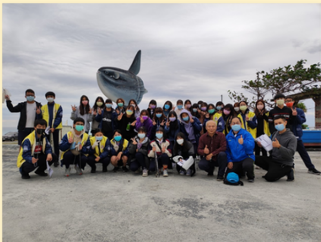
花商扶少團全員合影