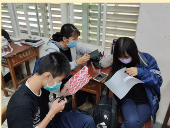
團員認真製作愛心工藝品