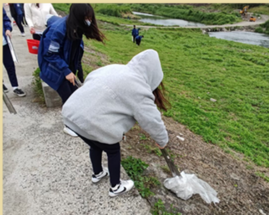
團員們認真撿拾河道邊遺落垃圾