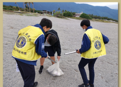
團員們細心撿拾沙灘上的菸蒂