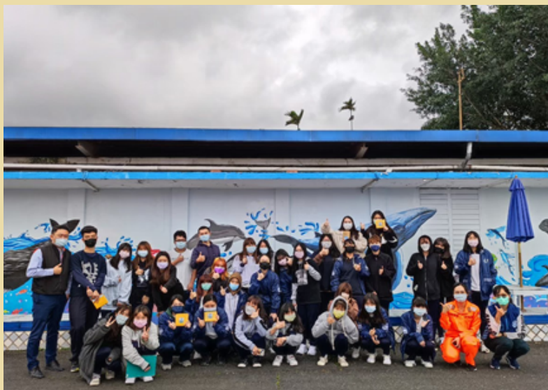
花商扶少團全員合影