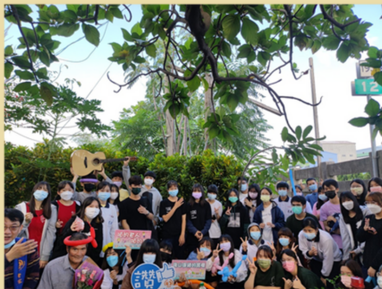
花商扶少團全員合影