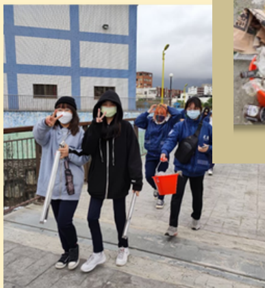
一邊欣賞河景 一邊撿拾垃圾