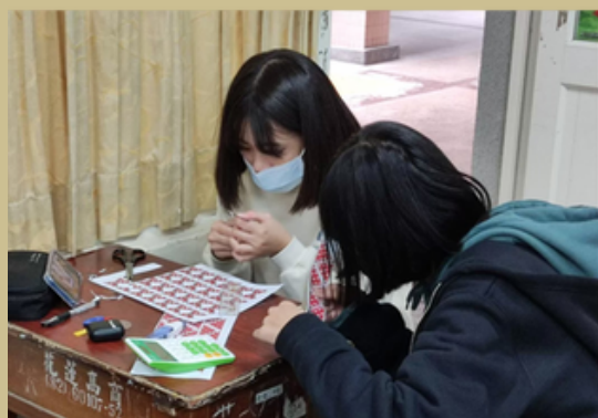
團員認真製作愛心工藝品