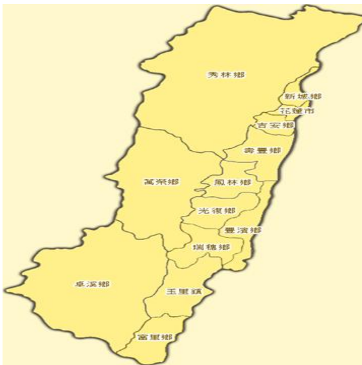
花蓮合法民宿家數分佈圖

秀林鄉 34 新城鄉 50 花蓮市 309 萬榮鄉 3 瑞穗鄉 45 富里鄉 22 吉安鄉 251 壽豐鄉 93 鳳林鄉 22 豐濱鄉 21 玉里鄉 19