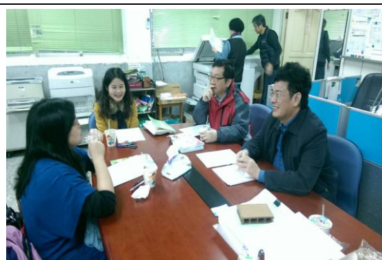
教師心靈成長社群