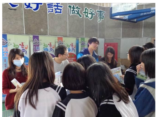
入班招生宣導(認識花商網站)