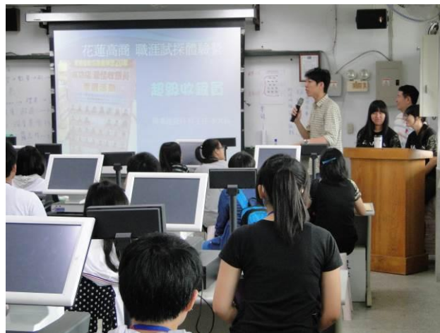
商業群職涯試探體驗營