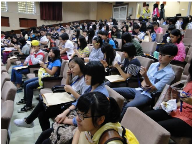
商業群職涯試探體驗營