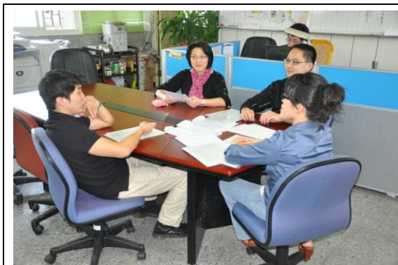
英文科專業學習社群