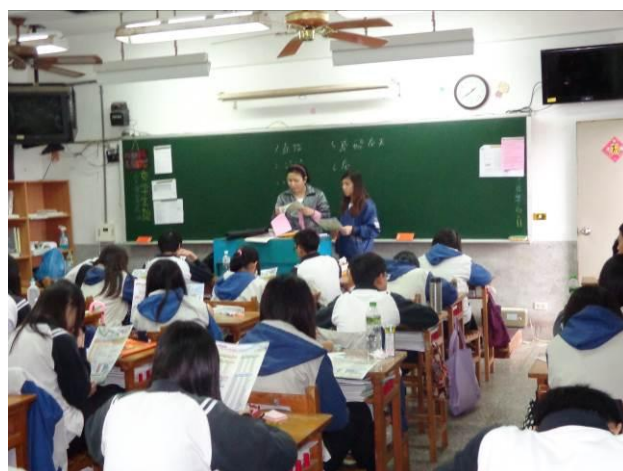
招生宣導(技職博覽會)