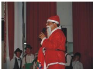
班聯會舉辦JINGO杯 聖誕歌曲比賽