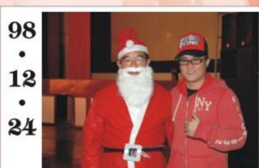
98.12.24 *98年聖誕晚會開放學生著便服到校，校長亦以聖誕老公公打扮致開幕辭，並與學生同歡。