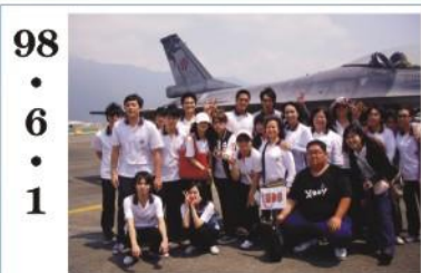
98.6.1 *三年級至天祥參加公民訓練。