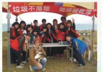
班聯會舉行「七星潭淨灘活動」