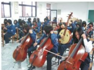
本學年成立國樂社