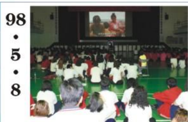
98.5.8 *生命教育影片播放，讓學生更了解要珍惜所擁有的一切。