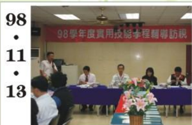
98.11.13 *98年實用技能班接受評鑑，獲得委員們一至的極高評價。