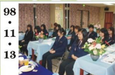
98.11.13 *98年實用技能班接受評鑑，獲得委員們一至的極高評價。