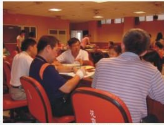
研討數位課程教材內容