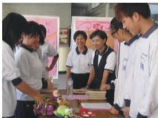
淨心社二手物資勸募活動