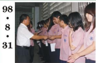
98.8.31 *開學典禮，校長頒發上學期各班前三名獎狀。