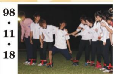
98.11.18 *同學們在各項競賽中展現團結合作及爭取榮譽的決心。