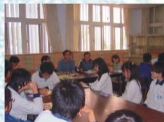
召開學生課業座談會，與學生建立師生教與學良好互動關係。