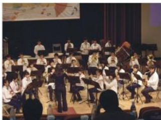
管樂隊參加花蓮縣音樂大賽