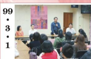
99.3.1 *99年第二專長班開訓典禮，由校長親自主持。