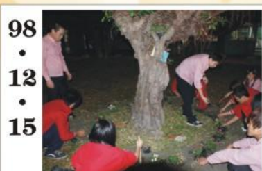
98.12.15 *美化校園種植花木。