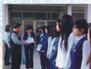
校長頒發各科作業優良獎狀