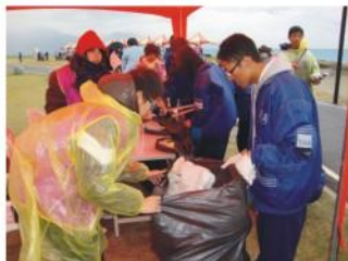
志願服務-七星潭淨灘活動