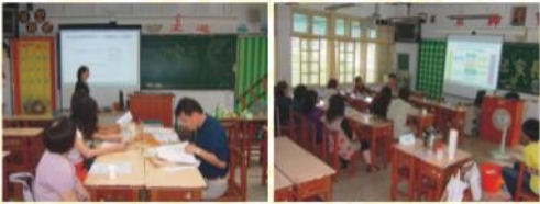
←三年級導師正親切詳細地用powerpoint為家長解說高三孩子的應注意的學習情形。

↓資處科科主任、應外科科主任、商經科科主任、會計科科主任等四科科主任正在為來校的一年級家長做各科的介紹。