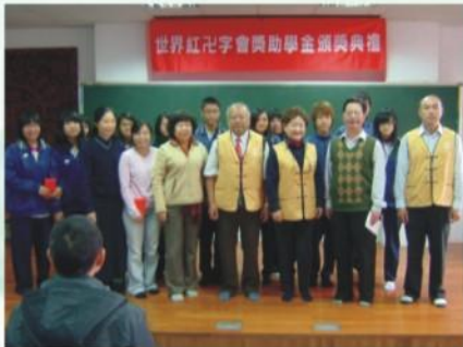
社團法人世界紅卍字會清寒學生獎學金