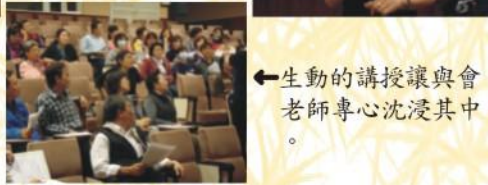
←生動的講授讓與會老師專心沈浸其中。