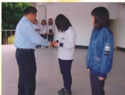
校長頒發故傅老師恆愉學生獎學金