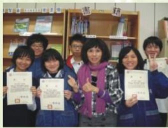
通過「會計乙級檢定」師生合影