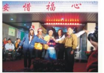
家長會「聖誕點燈儀式」