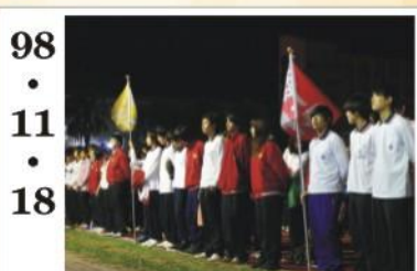
98.11.18 *同學們在各項競賽中展現團結合作及爭取榮譽的決心。