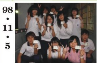
98.11.5 *文二甲取得網頁設計丙級證照同學合作。