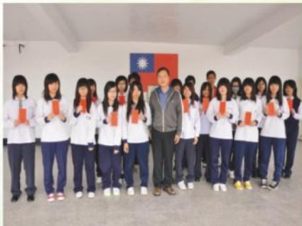
頒發優質化獎勵國中畢業生升學當地高中職獎學金