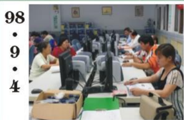
98.9.4 *辦理行政院研考會電腦班，嘉惠一般民眾學習電腦知識。