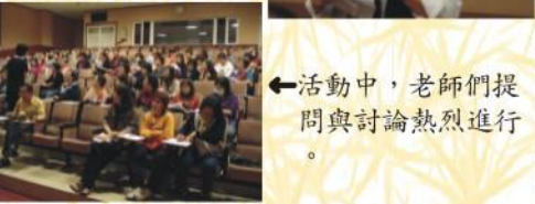
←活動中，老師們提問與討論熱烈進行。