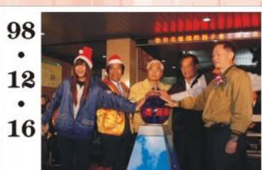
98.12.16 *由家長會贊助並邀請教育部中部辦公室長官為聖誕節點燈。