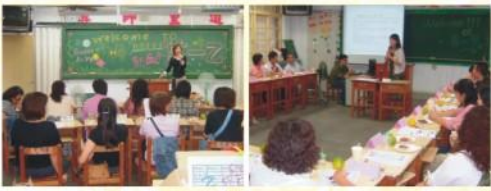
←一年級導師正親切詳細為家長解說孩子在學校情形。