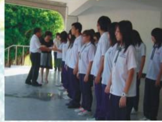
校長頒發暑期課業輔導考試各班前三名獎狀