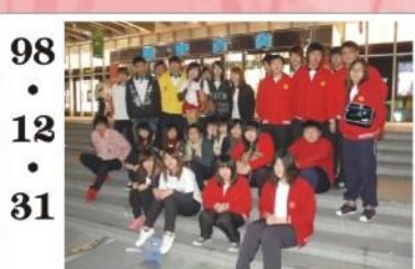
98.12.31 *企業參訪：遠百愛買公司