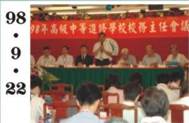
98.9.22 *全國校務主任會議在花蓮舉行，由本校承辦，共兩百多人與會。