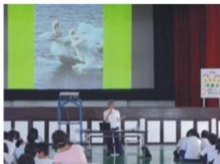
節能減碳議題演講