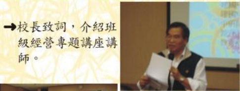
→校長致詞，介紹班級經營專題講座講師。