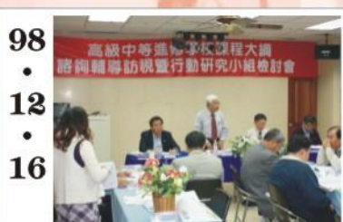
98.12.16 *本校承辦98課程大綱輔導訪視檢討會。