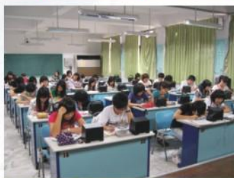
開設「英檢閱讀與聽力訓練班」