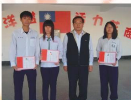
校長頒發財團法人宗偉章先生教育基金會獎學金