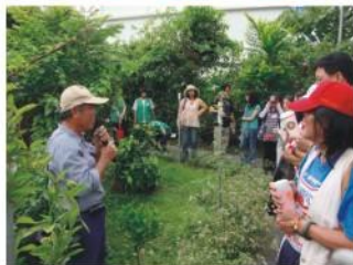
環保種子教師研習 參觀蝴蝶生態園