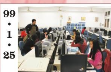
99.1.25 *文書處理科寒假補修學分。