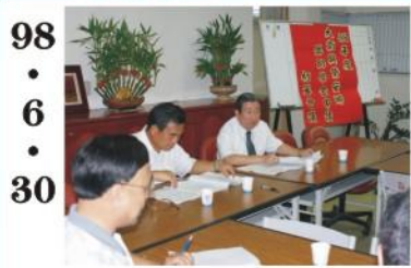
98.6.30 *大衛與黛安娜獎學金審查會。