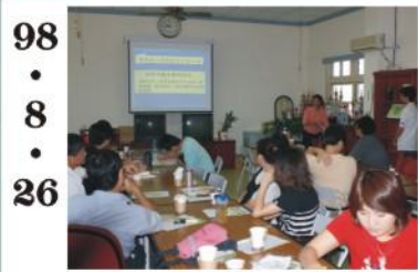
98.8.26 *進校期初校務會議，並辦理教師反毒研習。