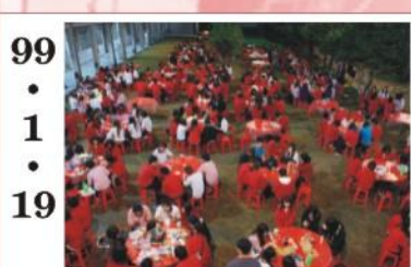
99.1.19 *辦理進修學校歲末圍爐活動，於教室中庭席開50幾桌，讓學生有機會在歲末互相祝福。