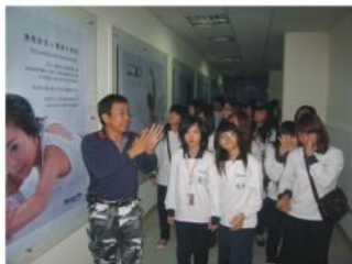
三年級公訓前參訪 海洋深層水公司