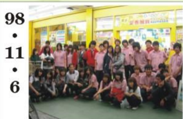
98.11.6 *進校校外企業參訪，本次參訪燦坤3C。