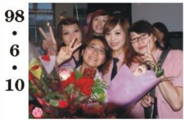
98.6.10 *97學年度畢業典禮及得獎學生。