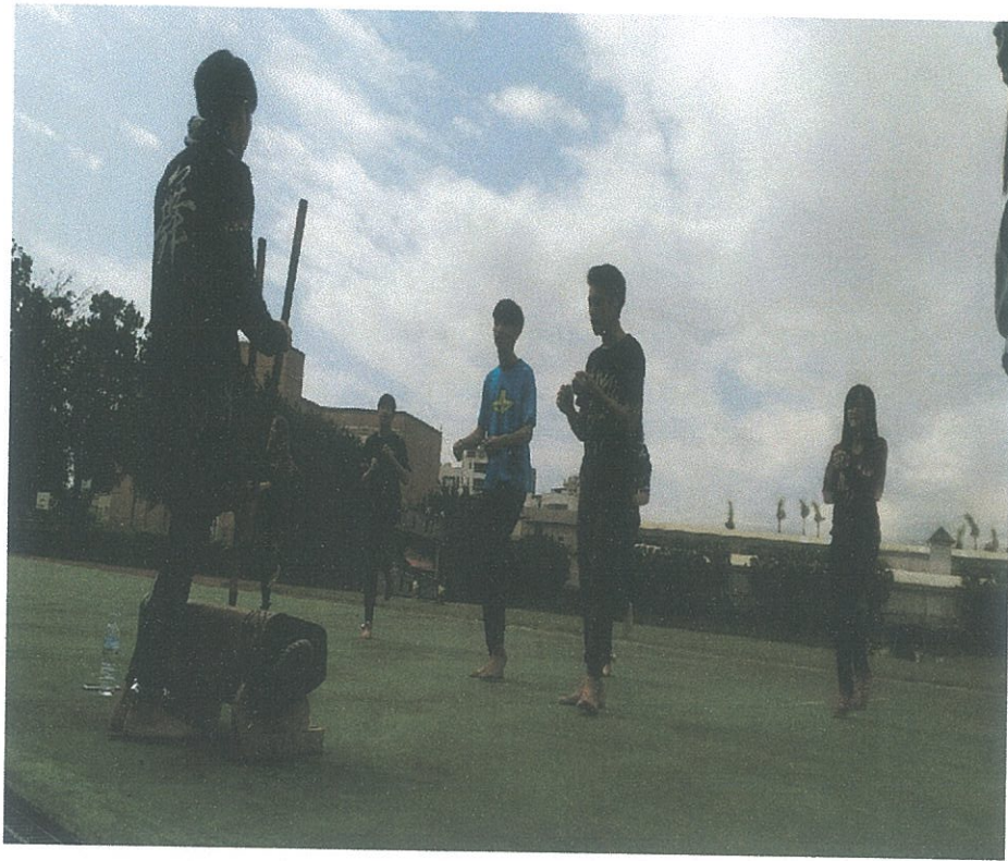
➤ 配合歌唱及鼓聲的舞蹈教學