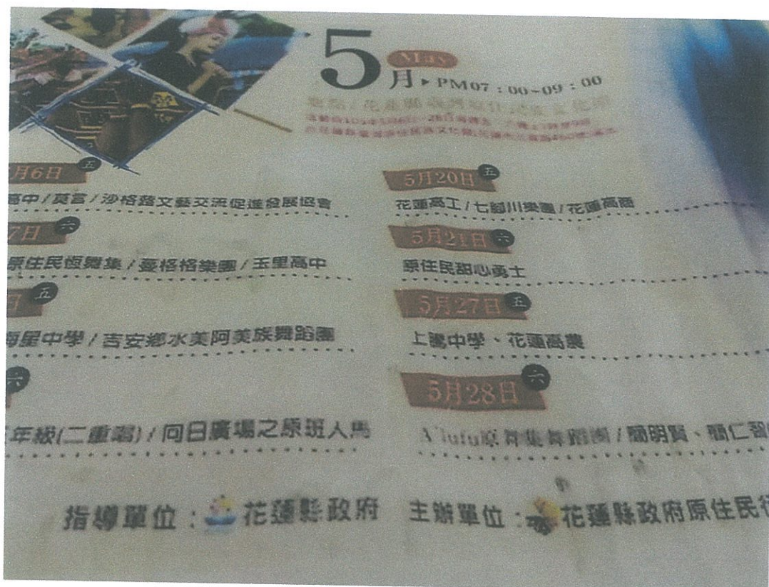
➤ 105/05/20 原住民文化館歌舞音樂