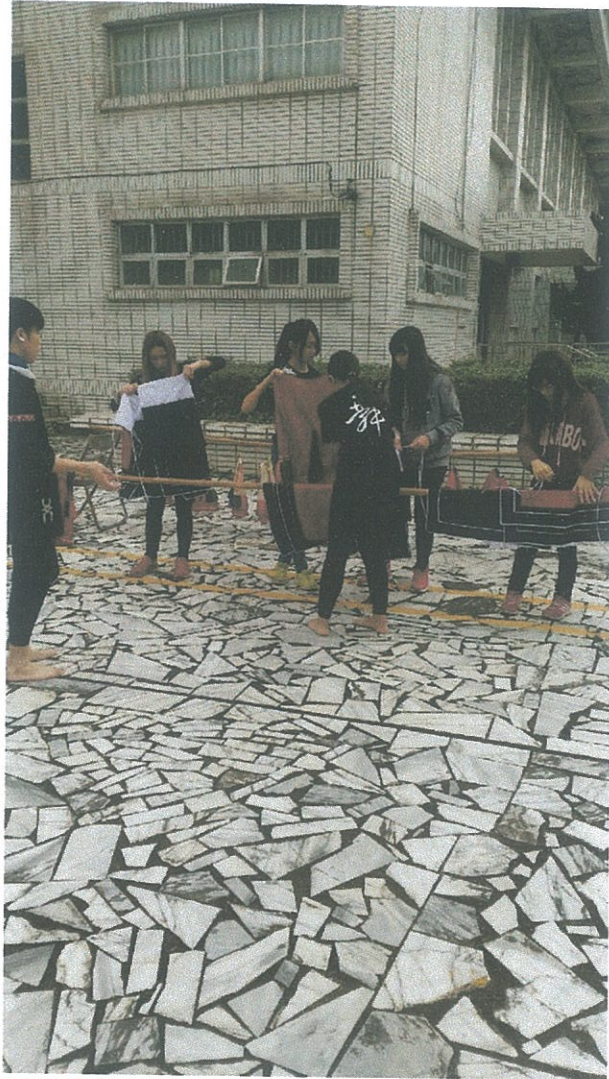
➤ 還有關於傳統服飾的洗滌等等...