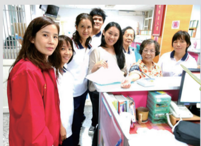
30歲以上同學血壓測量服務