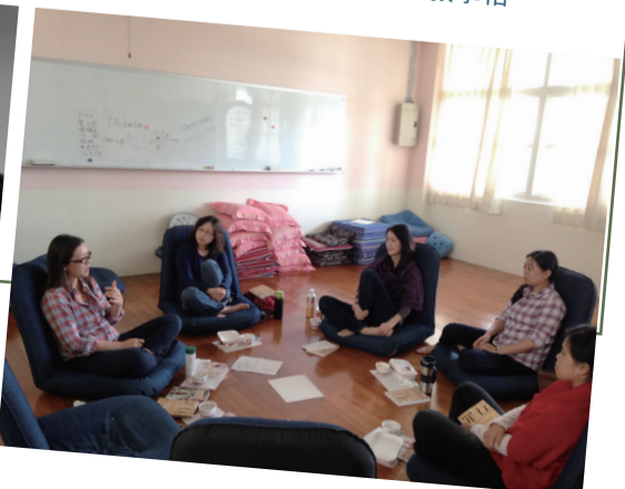
教師專業成長社群