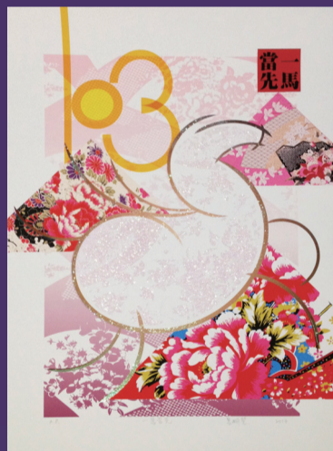
呂妍慧老師版畫創作 - 「一馬當先」榮獲中華民國第29屆版印年畫徵選活動優選