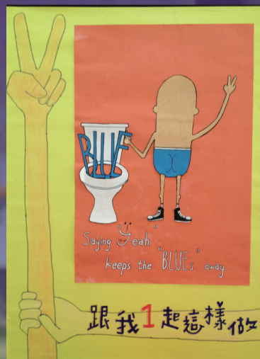
英二甲陳亮同學榮獲董氏基金會Blue go away 海報創作比賽 全國佳作