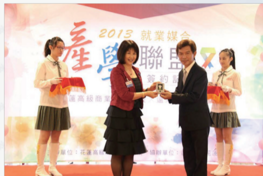
遠百攜手花商策略聯盟，首開花東商職產學合作先例