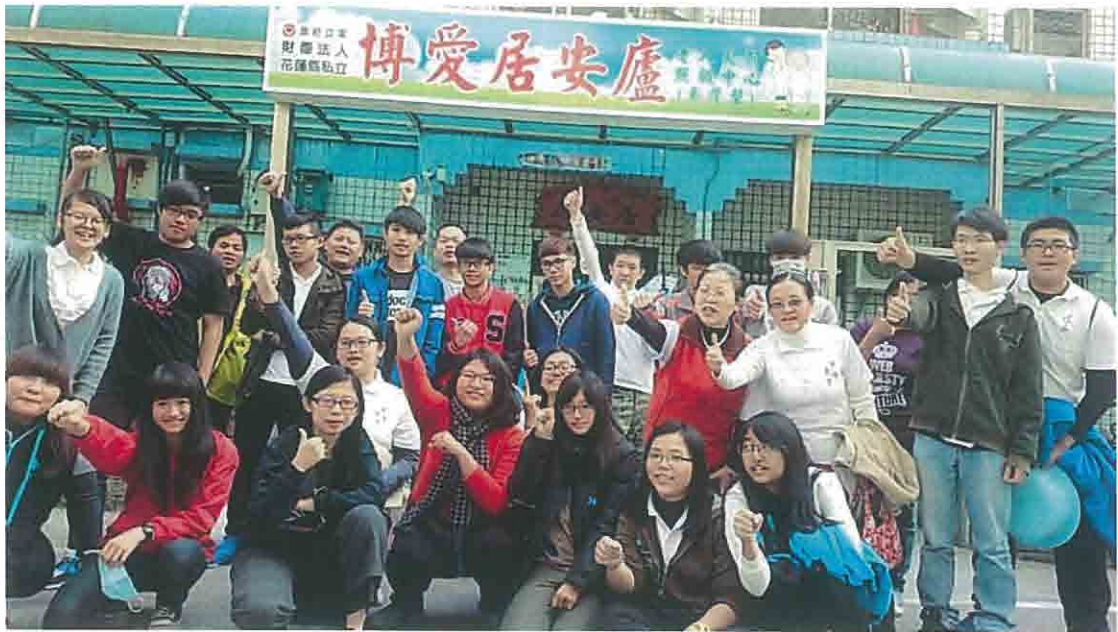
利用假日的時間，與崇德文教基金會合作， 一起出隊去博愛居服務老人。