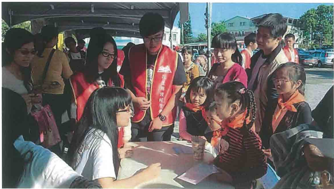
利用假日的時間，參與小狀元會考的志工活動， 主要是當遊戲關主，與小朋友互動。